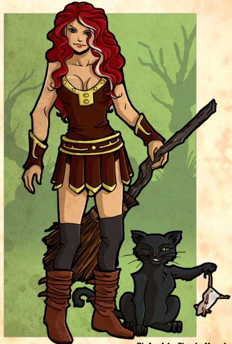
Die Insel der Piranha-Menschen

Heiltrank: Ein Heiltrank darf einmal eingesetzt werden, um einem beliebigen Helden alle verlorenen Ausdauerpunkte zurückzugeben, danach ist er verbraucht. Ein bewusstloser Held ist dadurch augenblicklich wieder einsatzfähig. Den Heiltrank während eines Kampfes einzusetzen, erfordert eine Handlung. Der Heiltrank kann von einem beliebigen Helden verabreicht werden, aber nur wenn der Besitzer des Heiltranks seine Erlaubnis dazu gibt.