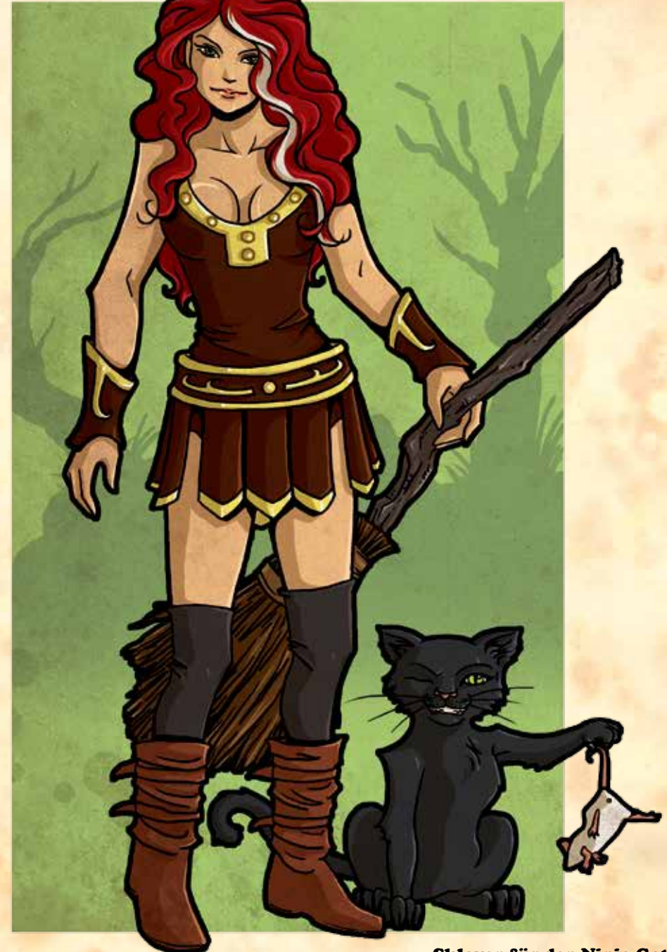
Sklaven für den Ninja-Gott

Blitzfausthandschuh: Magische Waffe – darf nicht gleichzeitig mit anderen magischen Waffen eingesetzt werden. Der Träger darf diese Waffe im Nahkampf einsetzen, muss dann aber mit 2 Würfeln weniger würfeln als üblich. Verliert der Gegner durch diesen Angriff mindestens 1 Punkt Ausdauer, so wird der Angriffswert des Gegners für den Rest der Runde um 1 reduziert. Bei Gegnern mit mehr als einem Angriff pro Runde muss der Held wählen, bei welchem davon der Angriffswert für den Rest der Runde um 1 sinkt.