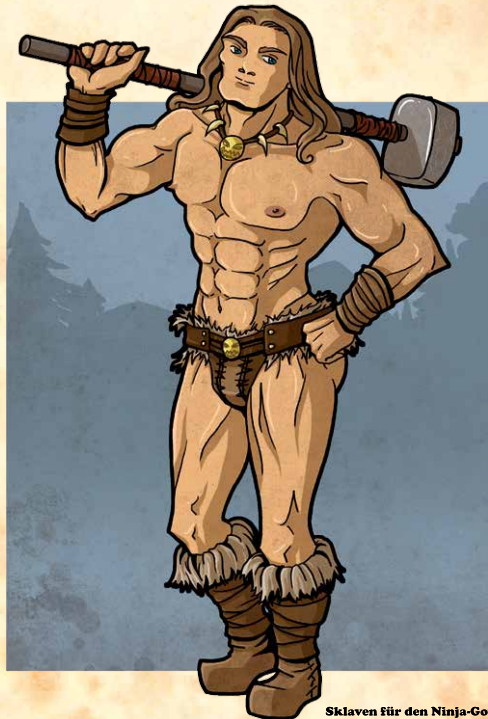
Sklaven für den Ninja-Gott